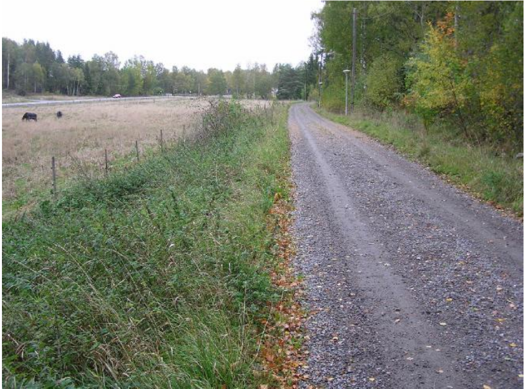
Gamla vägen mellan Angarn och Stora Karby öster om Haga. Den nuvarande vägen skimtar i bakgrunden.